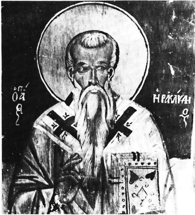
31. Άξέντης Συμεών, "Άγιος Ηρακλείδιος, τοιχ. άρ. 1

Cyprus, 84, εικ. 37-39 2. Σωτηρίου 1935, πίν. 111β, 114β (δίνει χρονολογία 1511) Ξυγγόπουλος 1957, 66, 67· Styliανου 1960, 118· Παπαγεωργίου 1975β, 366· Styliανου, Cyprus, 91, εικ. 40-43 3. Styliανου 1960, 118, σημ. 36· Παπαγεωργίου 1975β, 367· Styliανου, Cyprus, 106 (τό άποδίδει κυρίως σέ μαθητές του) 4. Παπαγεωργίου 1974, 205-206.