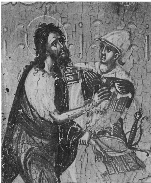
300. Στρελίτσας-Μπαθάς Μάρκος, Ἰω Πρόδρομος μέ σκηνές βίου, λεπτομέρεια, εἰκ. ἀρ. 1.

μεικά βιβλία φαίνεται ότι είχε μισθώσει από την 'Αδελφότητα κατοικία, όπου διέμενε από τό 1546 έως τό 1552, καί εξ αίτιας αὐτῆς τῆς συναλλαγῆς ἦλθε σέ δικαστική διαμάχη μέ τήν 'Αδελφότητα 3 . Ἡ 'Αδελφότητα, ἐξάλλου, τό 1550 κατέβαλε στόν Μπαθά διάφορα ποσά γιά ἐργασίες πού ἔκανε στό ναό τοῦ 'Αγίου Γεωργίου τῶν Ἑλλήνων 4 . Σύμφωνα μέ ἀνέκδοτο ἐγγραφο, στίς 7 Φεβρουαρίου 1560 ὁ Marcus Strilizza dictus Batta quondam domini Georgii νοίκιασε τό σπίτι του στό 'Ηράκλειο στόν Μανέα Χαλκιόπουλο 5 . Τόν ἴδιο χρόνο, σύμφωνα μέ ἄλλο ἐγγραφο, ὁ ζωγράφος Μανέας Χαλκιόπουλος* διόρισε στό 'Ηράκλειο πληρεξούσιο τήν ἀδελφή του, στήν ὁποία συνέστησε νά φροντίζει καί γιά τά συμφέροντα τοῦ θείου τους Μάρκου Μπαθά, πού ζοῦσε στή Βενετία 6 . Τό 1563 φέρεται ἐγγεγραμμένος στό Γ' Μητρώο τῶν μελῶν τῆς 'Αδελφότητας 7 ἐνῶ στίς 27 Ἰουνίου τοῦ ἴδιου χρόνου ἀπέτυχε νά ἐκλεγεί μέλος τοῦ σώματος τῆς Προσθήκης (Gionta) 8 . Τό 1570 πέθανε ἕνας γιός του στή Βενετία 9 . Τόν ἴδιο χρόνο μνημονεύεται σέ ἰσπανικό ἐγγραφο ὁ Marco greco, pintor, frontero de la ca-