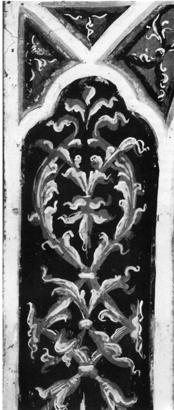
299. Στρελίτζας-Μπαθᾶς Θεοφάνης, Διακοσμητικό, τοιχ. ἀρ. 5.

ΒΙΟΓΡ. Ὑπῆρξε πιθανῶς πατέρας τοῦ Γεωργίου Μπαθᾶ* καὶ συγγενής τοῦ Θωμᾶ Μπαθᾶ* καὶ τοῦ Θεοφάνη Στρελίτζα-Μπαθᾶ* 1 . Ἐπίσης ὑπῆρξε θεῖος τῶν Μανέα καὶ Μάρκου Χαλκιάπουλων*. Σύμφωνα μέ ἔγγραφες μαρτυρίες, στὶς 16 Ἰουνίου 1538 ἐγινε μέλος τῆς Ἑλληνικῆς Ἀδελφότητος Βενετίας, στὴν ὁποία συνέχισε νὰ πληρώνει συνδρομές ἕως τὸ 1561 2 . Ἀπὸ τὰ τα-