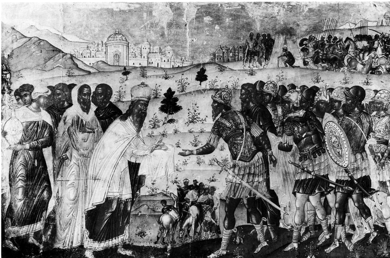
73. Λαμπάρδος Ἐμμανουήλ, Ἀβραάμ καί Μελχισεδέκ, εἰκ. ἀρ. 1.