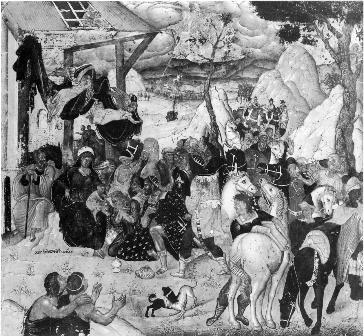
82. Λαμπάρδος Έμμανουήλ, Προσκύνηση τῶν Μάγων, εἰκ. ἀρ. 40.

Γλυκοφιλούσα, συλλογή Π. Κανελλοπούλου, Ἀθήνα 60 6) Τοῦ Πάθους, τ. συλλογή Δ. Λοβέρδου, Ἀθήνα 61 7) Ἡ Βάτος, 1596, τ. συλλογή Δ. Λοβέρδου, Ἀθήνα 62 Ἴω Πρόδρομος: 8) Κεφαλή, τ. συλλογή Δ. Λοβέρδου, Ἀθήνα 63 Μυστικός Δείπνος: 9) 1614, ἀρχαιοπωλεῖο Μαρτίνου, Ἀθήνα (ἀπό τ. συλλογή Α. Χ., Ἀθήνα, καί ἀργότερα συλλογή Δ. Μ., Ἀ-