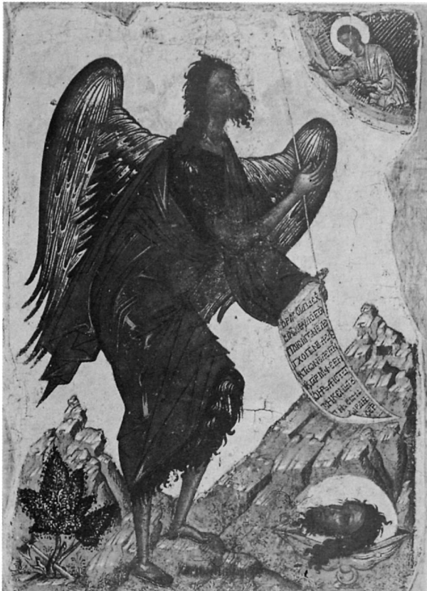
80. Λαμπάρδος Ἐμμανουήλ, Ἴω Πρόδρομος, εἰκ. ἀρ. 27.

συλλογή Σαρόγλου), Ἀθήνα 39 Προσκύνηση τῶν Μάγων: 40) ἰδιωτικὴ συλλογή, Ἀθήνα 40 Σταύρωση: 41) 1615-18, ν. Ἁγίου Γεωργίου τῶν Ἑλλήνων, Βενετία 41 42) Ἀρχαιολογικὸ Μουσεῖο, Συρακοῦσες, Ἰταλία 42 43) Μουσεῖο Ermitage, συλλογὴ Lichačev, Ἁγία Πετρούπολη, Ρωσία 43 Χριστός: 44) Μέγας Ἀρχιερεὺς, 1629, ν. Θεοτόκου Ἀντιβουινιώτισσας, Κέρκυρα 44 45) Μουσεῖο Κανελλοπούλου, ἀρ. 152, Ἀθήνα 45 46) Κεφαλή, Μουσεῖο Μπενάκη, Ἀθήνα 46 47) Κεφαλή, Βυζαντινὸ Μουσεῖο, Ἀθήνα 47 48) Κεφαλή, τ. συλλογὴ Ἑλ. Σταθάτου, Ἀθήνα 48 49) Κεφαλή (ἀποδ.) καὶ 50) Κεφαλή με ξύλινο πλαίσιο (ἀποδ.), Sotheby's, Νοέμβριος 1988, Λονδίνο 49 51) Παντοκράτωρ, συλλογὴ Ilias Neufert, Μόναχο 50 52) Παντοκρά-