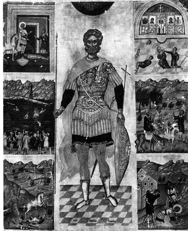
81. Λαμπάρδος Ἐμμανουήλ, Μηνᾶς καὶ σκηνές βίου, εἰκ. ἀρ. 36.

τωρ, συλλογὴ Π. Κανελλοπούλου, Ἀθήνα 51 53) Παντοκράτωρ, συλλογὴ εἰκόνων, Κύθηρα 52 54) Ἐνθρονος, Μουσεῖο, Κέρκυρα 53 55) Ἐνθρονος (ἀποδ.), ν. Σύναξης τῶν Ταξιαρχῶν, Χώρα, Πάτμος 54 Ὀνοούφριοις: 56) The Menil Collection, Houston, Τέξας, Η.Π.Α. (ἀπὸ τ. συλλογὴ Καμπάνη, Ἀθήνα, καὶ ἀργότερα Sotheby's 1984) 55 .