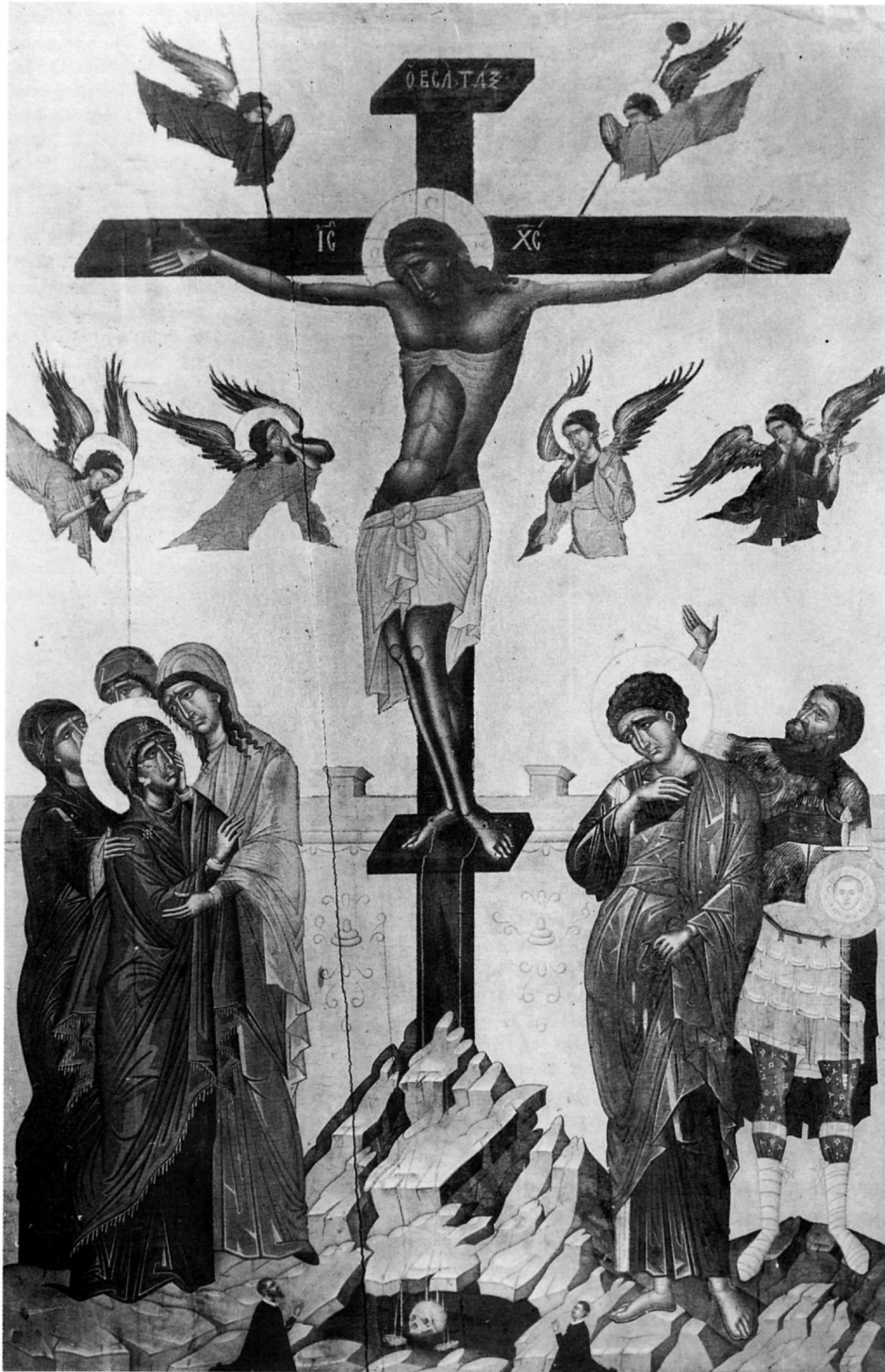
83. Λαμπάρδος Ἐμμανουήλ, Σταύρωση, εἰκ. ἀρ. 41.