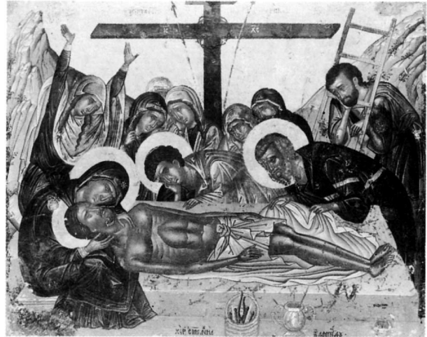
76. Λαμπάρδος Έμμανουήλ, Ήπιτάφιος Θρήνος, εικ. άρ. 8.

ΕΙΚΟΝΕΣ Άβραάμ και Μελχισεδέκ: 1) τ. συλλογή Δ. Λοβέρδου, Βυζαντινό Μουσείο, Άθήνα 1 Αικατερίνη: 2) 1620 (;), Μουσείο Μπενάκη, Άθήνα 2 Άσπασμός Πέτρου και Παύλου: 3) ν. Ύπαπαντής, πόλη, Ζάκυνθος 3 (κάηκε) Βασιλείος: 4) Κεφαλή, τ. συλλογή Μ. Καλλιγιά, Άθήνα 4 Γεώργιος: 5) Κεφαλή, Ζάγκρεμπ, Κροατία 5 6) Δρακοντοκτόνος, τ. συλλογή Van Rijn, Άμστερνταμ 6 Εισόδια ΘΚ: 7) Βυζαντινό Μουσείο (άπό τ. συλλογή Άν. Κ. Όρλάνδου) 7 , άρ. Τ. 2507/BM 7708, Άθήνα Ήπιτάφιος Θρήνος: 8) Βυζαντινό Μουσείο (άπό τή μονή Βρύσης στη Σίφνο) 8 και 9) Μουσείο Μπενάκη (άπό συλλογή Έλ. Σταθάτου), Άθήνα 9 Ζωσιμᾶς και Μαρία ή Αίγυπτία: 10) 1603, Rhode Island School of Design (άπό συλλογή Η. Bagge, Κοπεγχάγη) 10 Θεοτόκος: 11) Γλυκοφιλούσα, 1615, σκευοφυλάκιο Πατριαρχείου, Κάιρο 11 12) Όδηγήτρια, 1629, ν. Θεοτόκου Άντιβουνοιώτισσας, Κέρκυρα 12 13) Όδηγήτρια, Μουσείο Μπενάκη, Άθήνα 13 14) Όδηγήτρια, ιδιωτική συλλογή, Ύδρα 14 15) Τοῦ Πάθους,