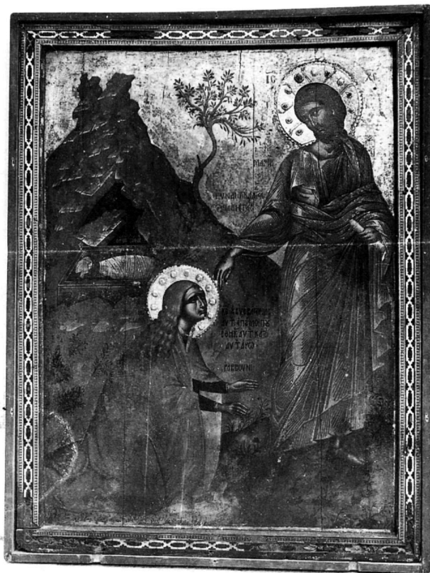
78. Λαμπάρδος Έμμανουήλ, Μή μου Άπτου, είκ. άρ. 34.

1626, καθολικό, μονή Άγίας Αικατερίνης, Σινά 15 (ένα μέρος της ύπογραφης της εικόνας έχει ξαναγραφεί από τον Ίωάννη Κορνάρο: σημ. Μ.Χ. 1962) 16) Τοῦ Πάθους, 164 [.] (;), ν. Άγίου Θωμά, Πάντοβα, Ίταλία 16 17) Τοῦ Πάθους, 16 [..], συλλογή Έλληνικοῦ Ίνστιτούτου, Βενετία 17 18) Pietà, μονή Ozren, Βοσνία 18 19) Κεφαλή, τ. συλλογή Καμπάνη, Άθήνα 19 20) Κεφαλή (άποδ.), συλλογή Γ. Πετσόπουλου, Λονδίνο 20 (πιθανή ταύτιση με την εικόνα άρ. 19) 21) Ένθρονη (άποδ.), ν. Σύναξης τών Ταξιαρχών, Χώρα, Πάτμος 21 22) Ίω Έλεήμων: 22) συλλογή Π. Κανελλοπούλου, Άθήνα 22 23) Παρεκκλήσιο Σερβοορθόδοξου ν. Dubronnik, Κροατία 23 24) Ίω Θεολόγος καί Πρόχορος: 24) συλλογή Έλληνικοῦ Ίνστιτούτου, Βενετία 24 25) Ίω Πρόδρομος: 25) Κεφαλή, Museo Civico, Πάντοβα, Ίταλία 25 26) ν. Εὐαγγελιστρίας, Κάστρο, Κεφαλονιά 26 27) Μουσείο Άντιβουνιώτισσας, Κέρκυρα 27 28) Ίω Χρυσόστομος: 28) ν. δημοτικοῦ νεκροταφείου, Κέρκυρα 28 Κοίμηση Θεοτόκου: 29) μονή Πα-