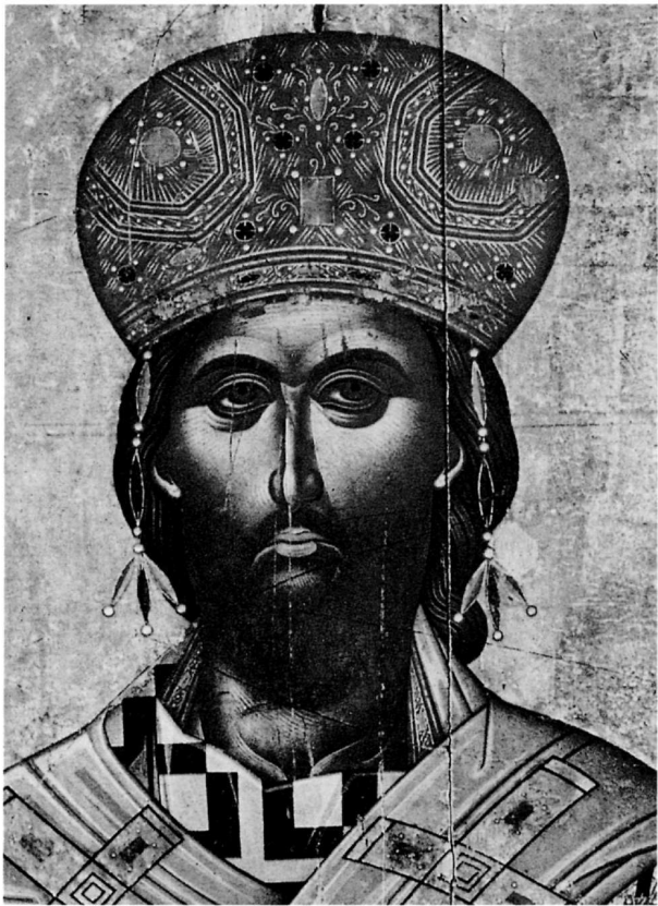
84. Λαμπάρδος Έμμανουήλ, ΧC Μέγας Αρχιερέυς, εικ. άρ. 44.

1. Σισιλιάνος 1935, 130· Bettini 1936-37, 272· Παπαγιαννόπουλος-Παλαιός 1946, 56, άρ. 386 2. Ξυγγόπουλος 1936, 30, άρ. 14, πίν. 13B· Δεληβορριάς 1980, 78· Δρανδάκη 1993, 543-544, άρ. 195 3. Σισιλιάνος 1935, 128 4. Σισιλιάνος 1935, 130· Bettini 1936-37, 272 5. Βοκοτόπουλος 1986β, 135, σημ. 14 6. Chatzidakis 1980, 96 7. Χατζηδάκη 1984, 37, άρ. 24· Όρλάνδος 1978, 681, εικ. 18· Άχειμάστου - Ποταμιάνου 1993, 565-566, άρ. 213 8. Σωτηρίου 1924β, 78, άρ. 5· Bettini 1936-37, 272, πίν. 41α· Χατζηδάκης 1969ε, εικ. 22· Chatzidakis 1981, 315, πίν. σελ. 362· Acheimastou-Potamiapou 1993, 234-235, άρ. 42, πίν. 23· Πύλες του Μυστηρίου, άρ. 9 (Μ. Άχειμάστου-Ποταμιάνου) 9. Ξυγγόπουλος 1951, 8, άρ. 5, πίν. 5 10. Σισιλιάνος 1935, 130· Bettini 1936-37, 271· Galavaris 1981, 38, πίν. XXXVc (άμφισβητεί τη γνησιότητα της ύπογραφής)· Βοκοτόπουλος 1986β, 134, σημ. 5 11. Σημ. Μ.Χ. 1962 12. Βοκοτόπουλος 1970γ, 340 και 1990, 77, άρ. 51, εικ. 168, 170, 342Α· 13. Ξυγγόπουλος 1936, 31-32, άρ. 16, πίν. 148· Δεληβορριάς 1980, 78· Δρανδάκη 1993, 547-548, άρ. 198 14. Σημ. Μ.Χ. 1973 15. Άμαντος 1928, 52· Bettini 1936-37, 271-272 16. Bettini 1936-37, 263-273, εικ. 38-39 (χρονολογία: 1647)· Βοκοτόπουλος 1986β, 134, σημ. 6 (χρονολογία: 1640) 17. Chatzidakis 1962, 85, άρ. 56, πίν. 44· Μανούσακας-Παλιούρας 1976, πίν. 1H· 18. Mazalié 1965, 76 και 1967,