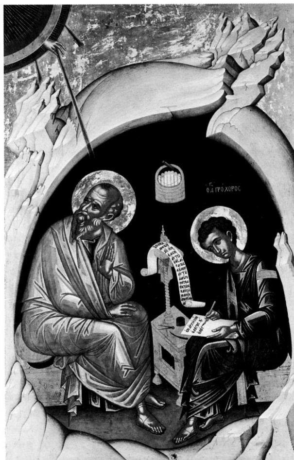
79. Λαμπάρδος Έμμανουήλ, Ίω Θεολόγος καί Πρόχορος, είκ. άρ. 24.

λαιοκαστρίτσας, Κέρκυρα 29 Κωνσταντίνος καί Έλένη: 30) Πατριαρχείο, Ίεροσόλυμα 30 Μελέτιος: 31) καθολικό, μονή Όσίου Μελετίου, Άττική (άποδ.) 31 Μερκούριος σκοτώνει τόν Ίουλιανόν τόν Παραβάτη: 32) στη βιβλιοθήκη Διδότου τό 1820, Παρίσι 32 Μή μου Άπτου: 33) 1603, Σερβοορθόδοξος ν., Dubronnik, Κροατία 33 34) πρό τοῦ 1621 34 , ν. Άγίου Κωνσταντίνου, Πατριαρχείο, Ίεροσόλυμα 35) ν. δημοτικοῦ νεκροταφείου, Κέρκυρα 35 Μηνᾶς μέ σκηνές βίου του: 36) Συλλογή Έλληνικοῦ Ίνστιτούτου, Βενετία 36 Νικόλαος: 37) 1632, τ. συλλογή Δ. Λοβέρδου, Βυζαντινό Μουσείο, Άθήνα 37 38) Ένθρονος, ν. Εὐαγγελιστρίας, Κάστρο, Κεφαλονιά 38 Παντελεήμων: 39) 1621, Βυζαντινό Μουσείο (άπο