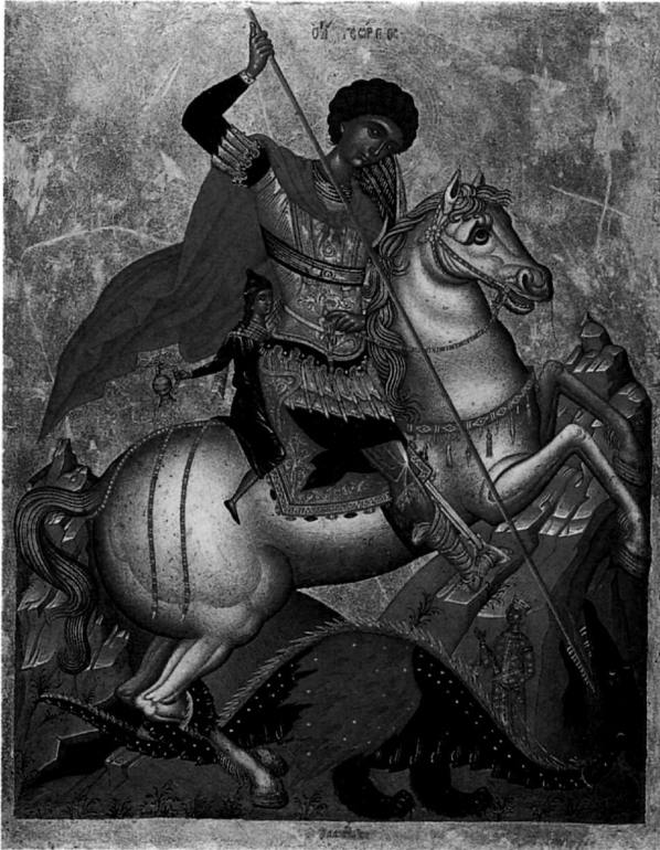
75. Λαμπάρδος Έμμανουήλ, Γεώργιος δρακοντοκτόνος, εικ. άρ. 6.

ΕΙΚΟΝΕΣ Άβραάμ και Μελχισεδέκ: 1) τ. συλλογή Δ. Λοβέρδου, Βυζαντινό Μουσείο, Άθήνα 1 Αικατερίνη: 2) 1620 (;), Μουσείο Μπενάκη, Άθήνα 2 Άσπασμός Πέτρου και Παύλου: 3) ν. Ύπαπαντής, πόλη, Ζάκυνθος 3 (κάηκε) Βασιλείος: 4) Κεφαλή, τ. συλλογή Μ. Καλλιγιά, Άθήνα 4 Γεώργιος: 5) Κεφαλή, Ζάγκρεμπ, Κροατία 5 6) Δρακοντοκτόνος, τ. συλλογή Van Rijn, Άμστερνταμ 6 Εισόδια ΘΚ: 7) Βυζαντινό Μουσείο (άπό τ. συλλογή Άν. Κ. Όρλάνδου) 7 , άρ. Τ. 2507/BM 7708, Άθήνα Ήπιτάφιος Θρήνος: 8) Βυζαντινό Μουσείο (άπό τή μονή Βρύσης στη Σίφνο) 8 και 9) Μουσείο Μπενάκη (άπό συλλογή Έλ. Σταθάτου), Άθήνα 9 Ζωσιμᾶς και Μαρία ή Αίγυπτία: 10) 1603, Rhode Island School of Design (άπό συλλογή Η. Bagge, Κοπεγχάγη) 10 Θεοτόκος: 11) Γλυκοφιλούσα, 1615, σκευοφυλάκιο Πατριαρχείου, Κάιρο 11 12) Όδηγήτρια, 1629, ν. Θεοτόκου Άντιβουνοιώτισσας, Κέρκυρα 12 13) Όδηγήτρια, Μουσείο Μπενάκη, Άθήνα 13 14) Όδηγήτρια, ιδιωτική συλλογή, Ύδρα 14 15) Τοῦ Πάθους,