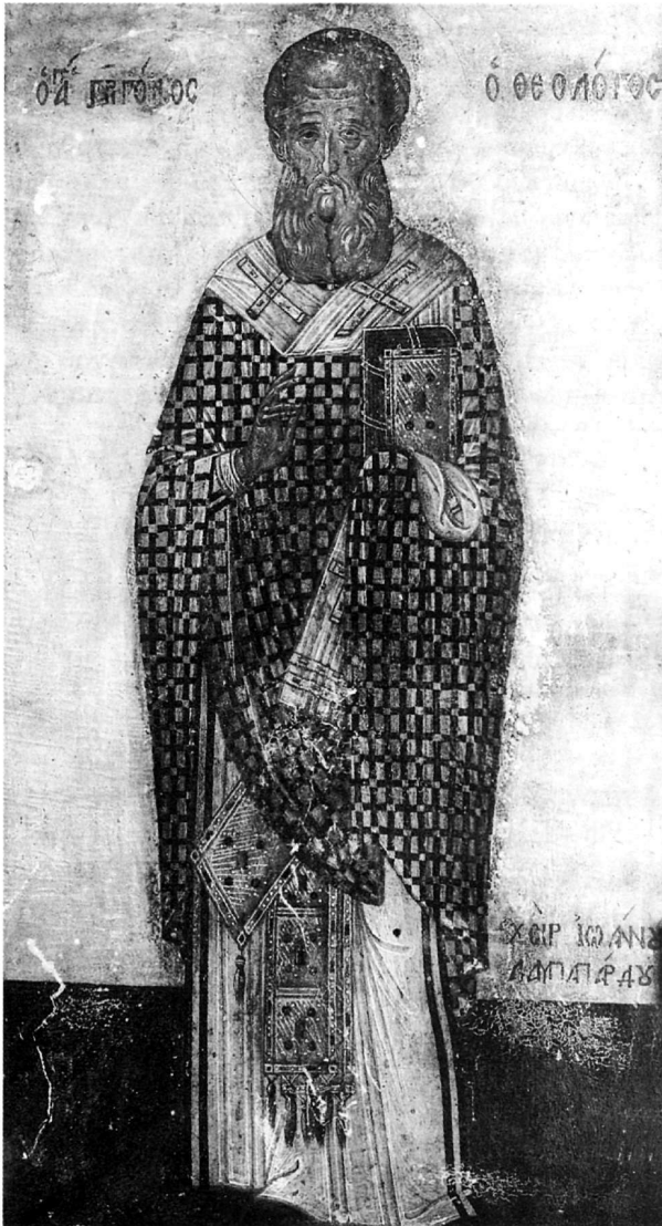
86. Λαμπάρδος Ἰωάννης, Γρηγόριος ὁ Θεολόγος, εἰκ. ἀρ. 2.

Καλοκύρης 1972α, πίν. 84 5. Σισιλιάνος 1935, 132· Ξυγγόπουλος 1936, 132, ἀρ. 18, πίν. 15α (τόν ταυτίζει μέ τόν Ἰωακείμ Λαμπάρδο*)· Bettini, ὁ.π.